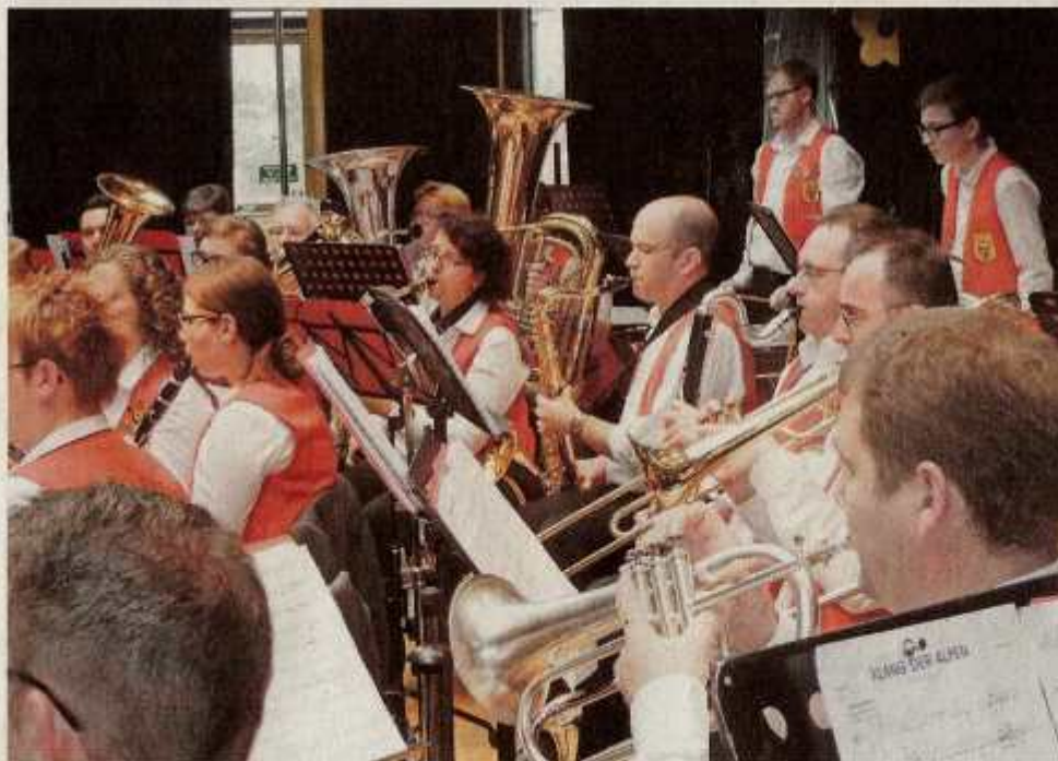
In Diensten von Andreas Hofer und Herbert Grönemeyer: Keine Berührungängste vor Hurra-Patriotismus und Ruhrpott-Pop hatte der Musikzug beim vorzüglichen jüngsten Auftritt.